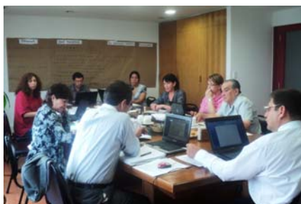
Reunión de coordinación Santiago de Chile, febrero 29 a marzo 2 de 2012